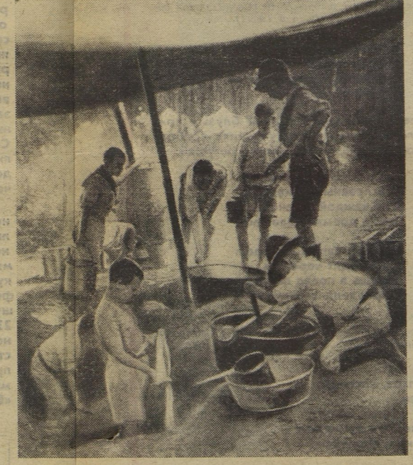
Поиск вели члены общества «Глобус» (Свердловский Дворец пионеров).